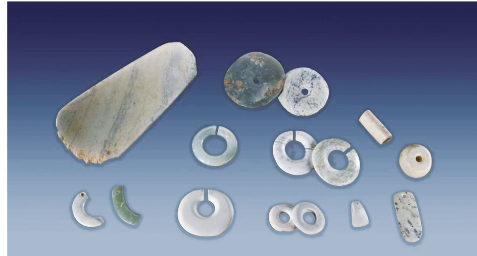
小南山遗址出土玉器

依托本次专题展览契机，许多玉器文物首次展出，释放馆藏精品资源。展示了明清宫廷与民间玉雕工艺特色、各阶层用玉风尚与礼仪习俗，让本地观众近距离品鉴宫廷重器的典雅气度与民间玉作的质朴意趣，充实了博物馆高