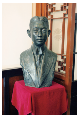
朝仓文夫制梅兰芳半身铜像

经过数年精心筹备，1930年梅兰芳正式开启了为期近半年的赴美演出、交流活动。这是京剧艺术首次有组织、有规模地在西方主流文化视野中亮相。梅兰芳剧团抵达美国后，加入张彭春作为剧团导演，迅速根据各方反馈进行调整，尊重当地观众的观演习惯和喜好，改变演出剧目和宣传策略。剧团所到之处，均引起极大轰动，在正处于大萧条时期的美国创下