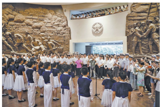
南昌市青少年宫合唱团演唱歌曲《红星歌》《中国少年》

“红色讲堂”：从专家讲变成大家讲。“红色讲堂”最初请的是党史专家、老党员，内容权威但形式偏严肃，