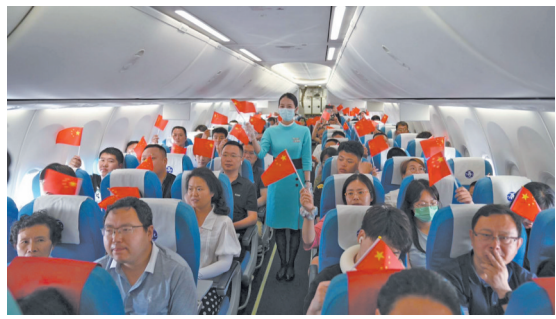
航班上的红色主题“空中课堂”