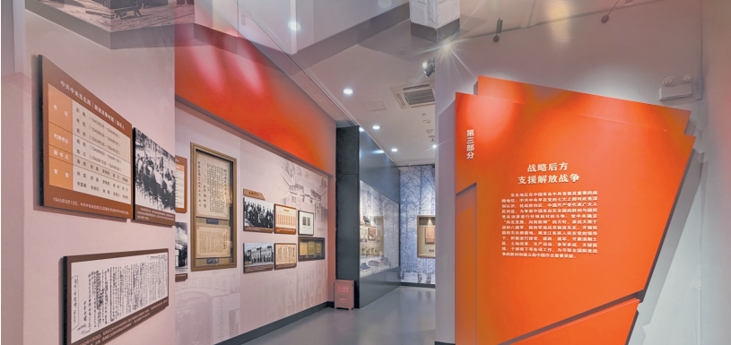
第三部分“战略后方 支援解放战争”