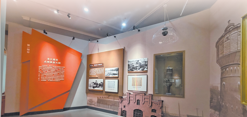
第一部分“龙江建党 点燃革命火种”

第三部分“战略后方 支援解放战争”立足抗战胜利后中共中央提出“向北发展、向南防御”的战略方针,聚焦1945年至1949年黑龙江地区全力支援全国解放的重大贡献。遵照党中央建设东北根据地指示,大批党内