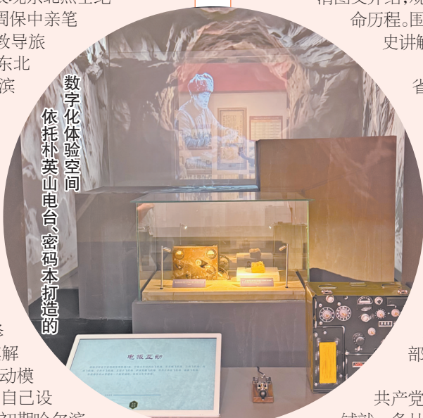
数字化体验空间 依托朴英山电台、密码本打造的

展览开篇展示中东铁路罢工铜汽笛,观众在特定区域驻足即可聆听百年前工人罢工时的鸣笛声响,跨越时空还原中俄工人联合反帝罢工的壮阔场景。抗战展区依托朴英山电台、密码本打造数字化体验空间,数字大屏以三维动画复原东北抗联小分队深山潜伏、深夜发送情报信息的画面,配套复刻电码操作按键,让观众通过动手实践模拟情报发送,切身感受隐蔽战线工作的凶险。观众通过与文物互动,打破单向观展模式,切身体会革命历史的珍贵瞬间。