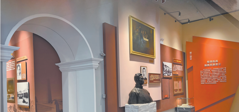
第二部分“坚持抗战 拯救民族危亡”