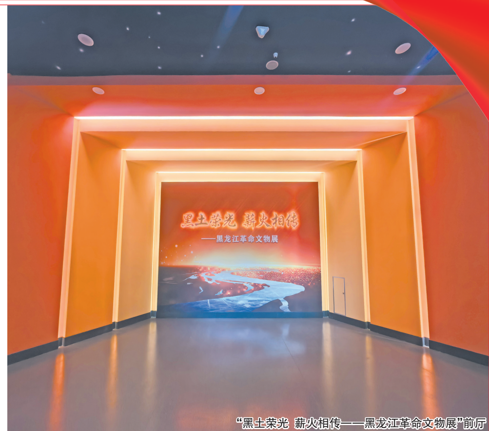
“黑土荣光 薪火相传——黑龙江革命文物展”展厅

在中国共产党成立105周年重要历史节点,6月30日,在黑龙江省文化和旅游厅的领导下,东北烈士纪念馆立足黑土地丰厚的馆藏红色资源,推出“黑土荣光 薪火相传——黑龙江革命文物展”。展览以百年党史宏大叙事为底色,呈现黑龙江地区发展脉络,打破传统陈列叙事模式,融合文物实证、史实叙事、数字科技、沉浸式体验等多元展陈模式,书写了党带领龙江儿女播撒革命火种、浴血抗日救国、建设战略后方、支援全国解放的奋斗史诗,以革命文物为鲜活载体,活化红色历史,深挖东北红色文脉内涵,践行新时代革命文物保护利用与红色文化传承的使命。