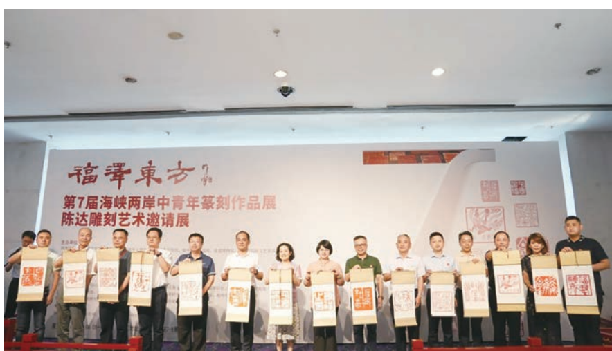
嘉宾与台湾青年一道“揭福”

开幕式上,福建省文化和旅游厅党组成员、副厅长、省文物局局长,福建博物院负责人傅荣生在致辞中表示,博物馆是收藏艺术、典藏文明并向社会公众开放的重要场所,浓缩着博大精深的中华文化。本届篆刻大赛吸引了海峡两岸的广大中青年艺术家,大赛作品集在博物馆进行展览展示,并将到全国各地进行巡回展出,彰显篆刻艺术的时代光芒。福建省文化和旅游厅、福建省文物局将一如既往地支持篆刻大赛的活动,希望篆刻艺术家们坚持初心、不断前行,勤耕不辍,繁荣篆刻艺术,再创璀璨成就。