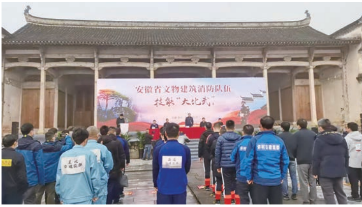
文物建筑消防队伍技能比武

来,得到各地高度关注和积极响应。共受理典型案例申报139项。按照导向性、公益性、均衡性、示范性、典型性、创新性原则,组织专家讨论评议,最终遴选80项典型案例。此次推介活动主题鲜明、主体多元、形式多样,遴选公布的典型案例在制度建设、组织管理、站点建设、活动和项目策划等方面具有代表性和示范性,引导广大志愿者积极投身博物馆事业。下一步,将结合学习雷锋60周年活动,通过多种形式加大博物馆志愿服务典型案例宣传推介力度,吸引更多社会公众参与到新时代志愿服务工作中来,不断提升博物馆公共文化服务水平。