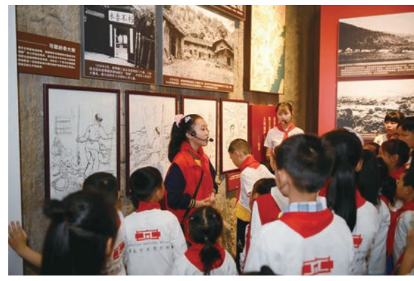
博物馆青少年志愿者在展厅进行讲解