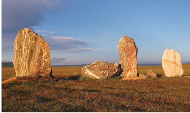
日干乔红军过草地遗址

持续擦亮草原最纯正的底色。着力摸清家底，积极开展红色遗址、红色文物、烈士纪念设施等红色资源专项调查，建立革命文物资源目录和分级保护项目库。着力保护传承，深入实施红色文化保护传承和弘扬工程，推进亚克夏山红军烈士墓文物保护修缮，建成四川省长征干部学院阿坝州雪山草地分院红原教学点，持续打造红军遗址主题游径。着力科学利用，依托雅克