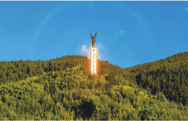
红军长征纪念碑碑园

“红色草原”上的一草一木、一山一水，都见证着中国革命和建设的光辉历程。四川省印发《通知》，为今后一个时期做好“红色草原”保护利用工作指明了方向。一是正确认识重要意义。“红色草原”是中国革命史上的一个重要象征，它见证了党在艰难困苦岁月里带领人民群众革命奋斗的伟大历程，承载着党的初心使命，蕴含着中华民族伟大复兴的精神力量。只有正确认识“红色草原”的历史价值和文化意义，才能更好地推动保护利用工作。二是着力加强环境保护。积极推动在“红色草原”进行科学合理的生态修复和生态保护工程，采取综合性措施，不断健全专门保护机构，加强法制建设，进一步提升“红色草原”的科技支撑和信息化管理水平。三是科学推进资源开发。要