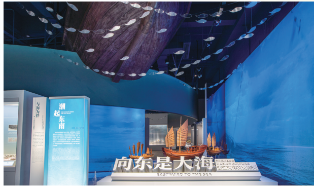
“向东是大海——浙江海洋文化陈列”展厅