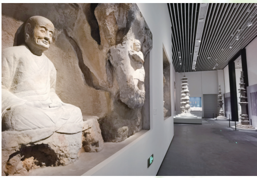
“浙江一万年——浙江历史文化陈列”展厅 杭州烟霞洞罗汉像