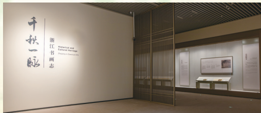
“千秋一脉——浙江书画志”展厅