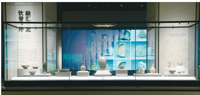
“江南秘色——浙江古代青瓷陈列”展厅