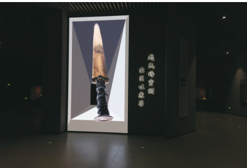
“浙江一万年——浙江历史文化陈列”展厅