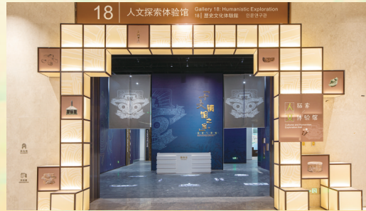
“人文探索体验馆”展厅