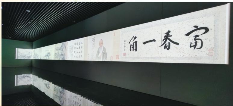
“山水之间——富春山居图人文数字陈列”展厅