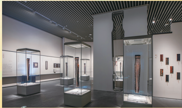
“太古之音——古琴与国人的音韵世界”展厅