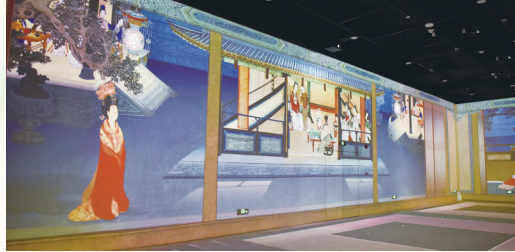
“丽人行——中国古代女性图像数字体验展”展厅