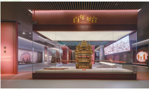
“伊人红妆——宁绍平原的传统婚俗与嫁妆”展厅